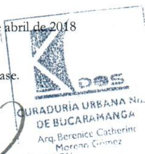
Curador Urbano No. 2 de Bucaramanga.